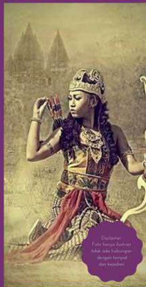
Disajikan Foto karya Achmad Hala, foto kolaborasi dengan templat dari Korpri