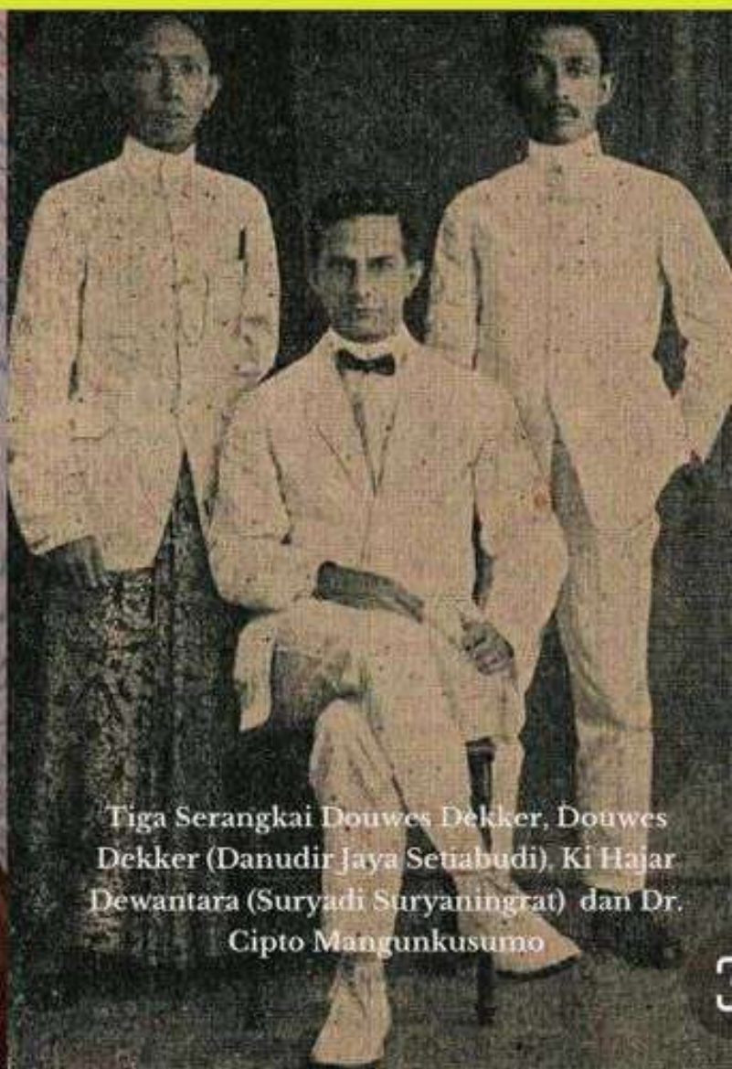
Tiga Serangkai Douwes Dekker, Douwes Dekker (Danudir Jaya Setiabudi), Ki Hajar Dewantara (Suryadi Suryaningrat) dan Dr. Cipto Mangunkusumo