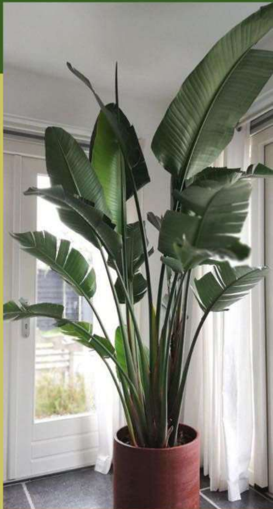
72 Anthurium Daun Fantastis