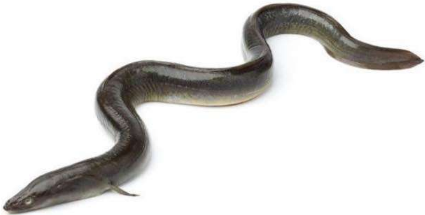
BUDIAYA BELUT DAN SIDAT ; UNTUNG BESAR DENGAN MODAL KECIL

Belut dan sidat tergolong jenis ikan air tawar yang sangat berpotensi dibudidayakan dan dikembangkan sebagai sumber penyedia pangan protein hewani untuk mencukupi kebutuhan pangan manusia maupun kepentingan perdagangan (komoditas ekspor).